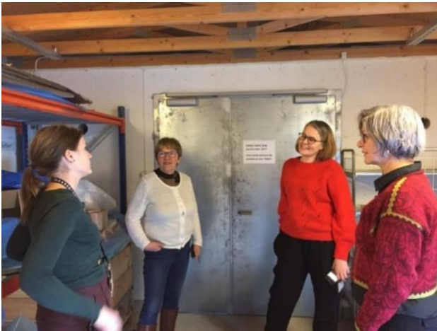
Styreseminar med omvisning, presentasjoner og erfaringsdeling ved Bevaringstenestene i Hordaland.

På grunn av pandemien ble mye aktivitet stengt ned og Museumsforbundets årsmøte med valg ble utsatt til september. I oktober ble det gjennomført et styremøte med både gammelt og nytt styre for å få til en god kunnskapsoverføring. Nesten hele det nye og det gamle styret deltok også på seminaret «Alltid beredt! – beredskap og beredskapssamarbeid» som ble arrangerte i november i samarbeid med MiST. Seminaret ble arrangert med koronarestriksjoner og maks 50 personer i salen. I tillegg har det vært løpende e-postkorrespondanse og telefonisk kontakt mellom styrets medlemmer.