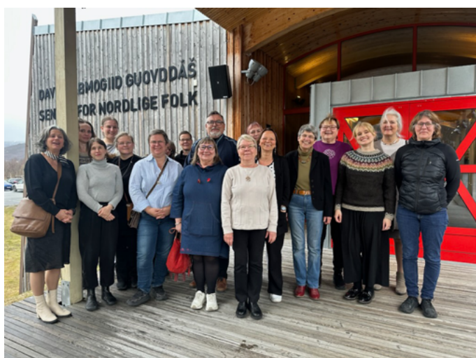
Deltakerne til Dávvirat Duiskkas' (DD) workshop på Davvi Álbmogiid Guovddáš/Center of Northern Peoples (DAG).

I dagene 19.–23. mai ble prosjektets fjerde og femte workshop med offentlige arrangement gjennomført på Davvi Álbmogiid Guovddáš/Senter for nordlige folk i Manddalen i Nord-Troms og på Samisk høyskole for Guovdageainnu gilišillju/Kautokeino bygdetun, Riddo-DuottarMuseat i Vest-Finnmark. Tema for workshopen i samarbeid med Senter for nordlige folk var samiske mattradisjoner, mens gjenstander i pels og skinn var tema for workshopen i samarbeid med Kautokeino bygdetun/RDM. Workshop om gjenstander i pels og skinn ble også strømmet. For de offentlige arrangementene var temåene samisk mattradisjon og samisk kulturarv i tyske museer. Les mer her: Workshops with public events at Center of Northern Peoples and Sámi University of Applied Sciences for Kautokeino Municipal Museum/RiddoDuottarMuseat – Norges museumsforbund ; https://museumsforbundet.no/nyheter/velkommen-til-miniseminar-pa-varanger-samiske-museum-torsdag-kveld-28-8/ ; https://museumsforbundet.no/nyheter/velkommen-til-miniseminar-pa-avv-om-skoltesamisk-kulturarv-i-tyske-museer/