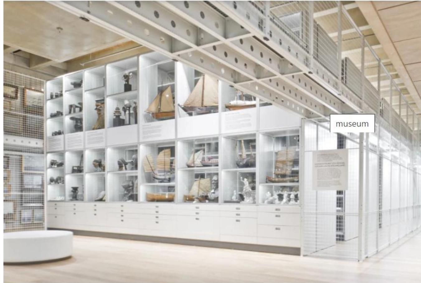
Museum aan de stroom, Nederland. Skjerm bilde fra Brynzeel: https://bruynzeel.no/produkter/museum-mobil-reoler-med-hoy-tetthet

Publikum kan vandre fritt rundt, som i en utstilling. Samlingene magasineres på reoler, med stengsler foran (glass eller gitter), slik at samlingene er sikret mot tyveri.