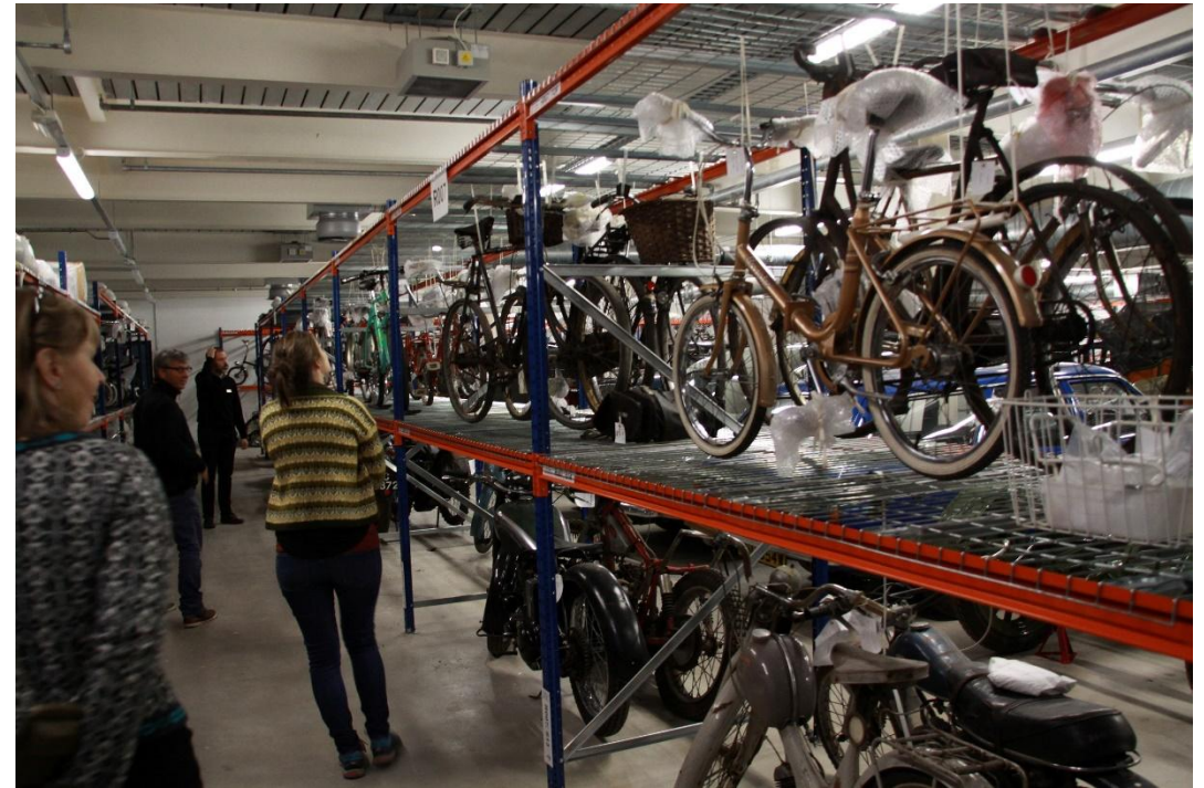
Bilde fra en studietur til Glasgow Resource Center i 2015, på omvisning i et magasin, sammen med en konservator.

Publikum kan bli med på en omvisning med konservatorer. Objekter magasineres som vanlig, men en kan legge litt/mye til rette. For eksempel vise fram de fineste objektene ved inngangen til magasinet, og ha litt bedre plass i noen områder, der publikum skal passere. I andre deler av magasinet kan objektene være lagret tettere.