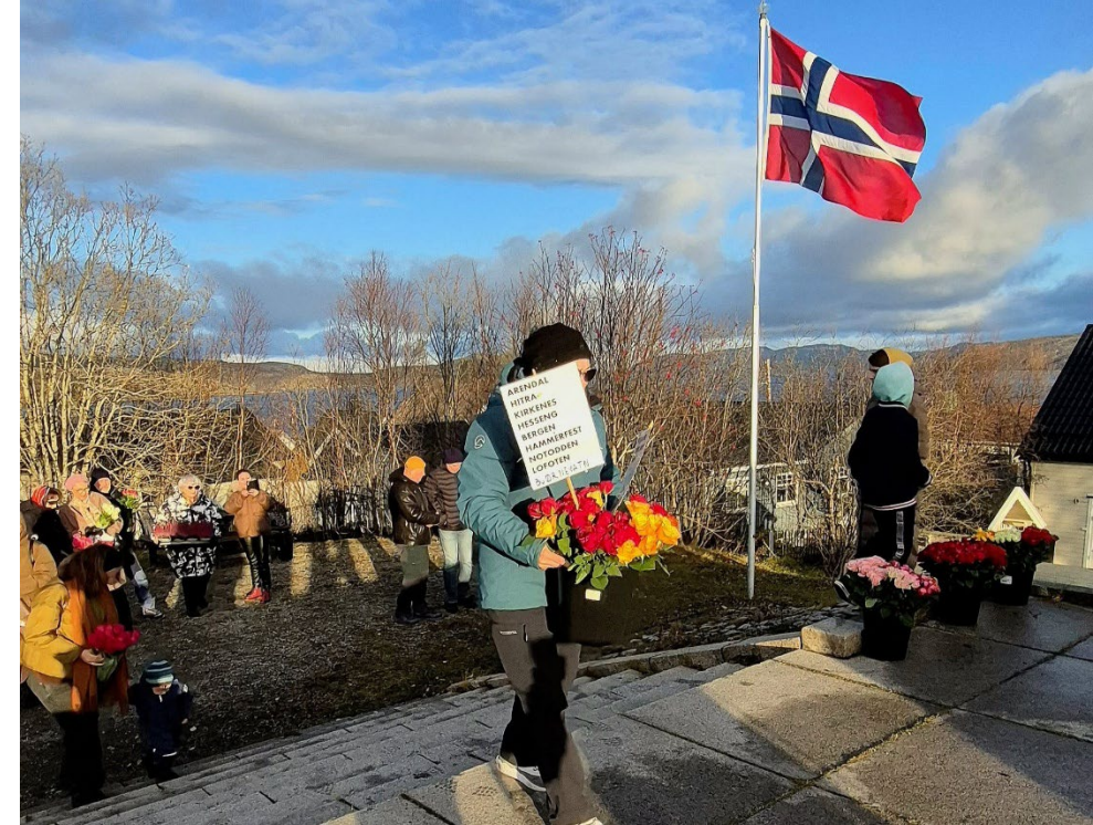
25. Oktober 2025, Kirkenes (Generalkonsulatet FB side)