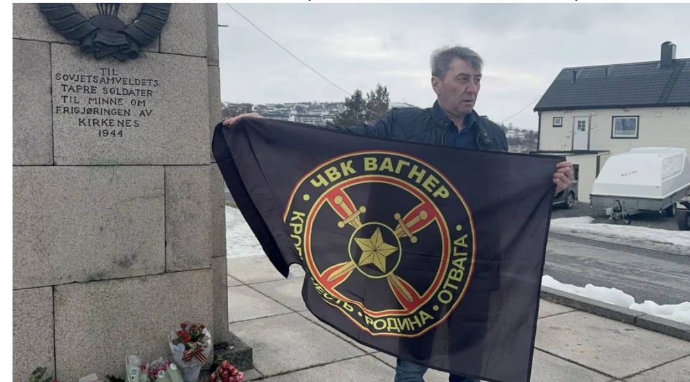
Mannen gratulerte russiske soldater i Ukraina med seiersdagen, ifølge The Barents Observer, 9. mai 2025