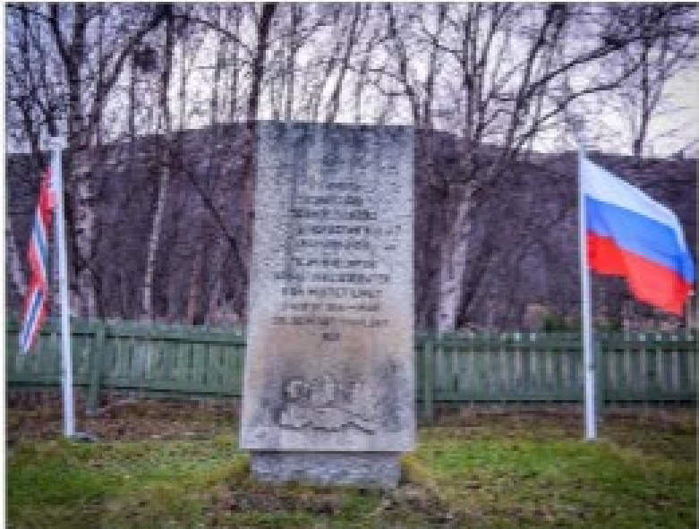
FLAGGET: Flagget ble tatt ned av noen som har gjort det. Det er de som har gjort det. Det er de som har gjort det.

Det er de som har gjort det. Det er de som har gjort det. Det er de som har gjort det.