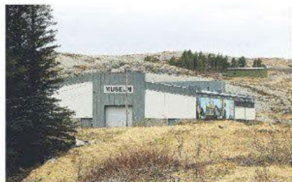
MUSEET: Helgeland Museums avdeling i Lurøy holder til i bygget ved Grønsvik kystfort. Torsdag foregikk en konferanse om glemte historier her.