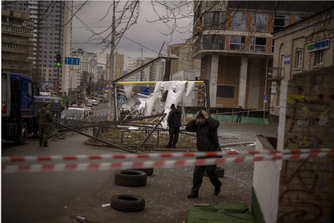
POLICE OFFICERS INSPECT AN AREA AFTER AN APPARENT RUSSIAN AIRSTRIKE IN KYIV UKRAINE, THURSDAY, FEB. 24, 2022.

✕ Krigen i Ukraina, Ukraina | Rørende øyeblikk d... 🔒 ranablad.no